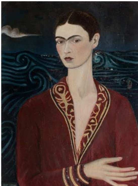
Autorretrato com vestido de veludo – 1926